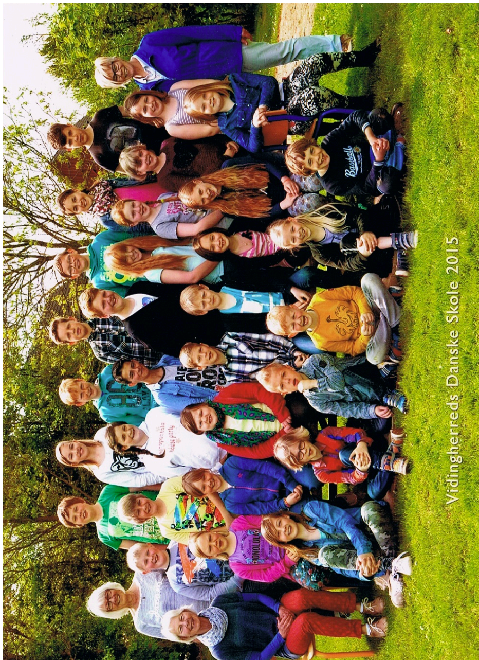
Vidlingherreds Danske Skole 2015